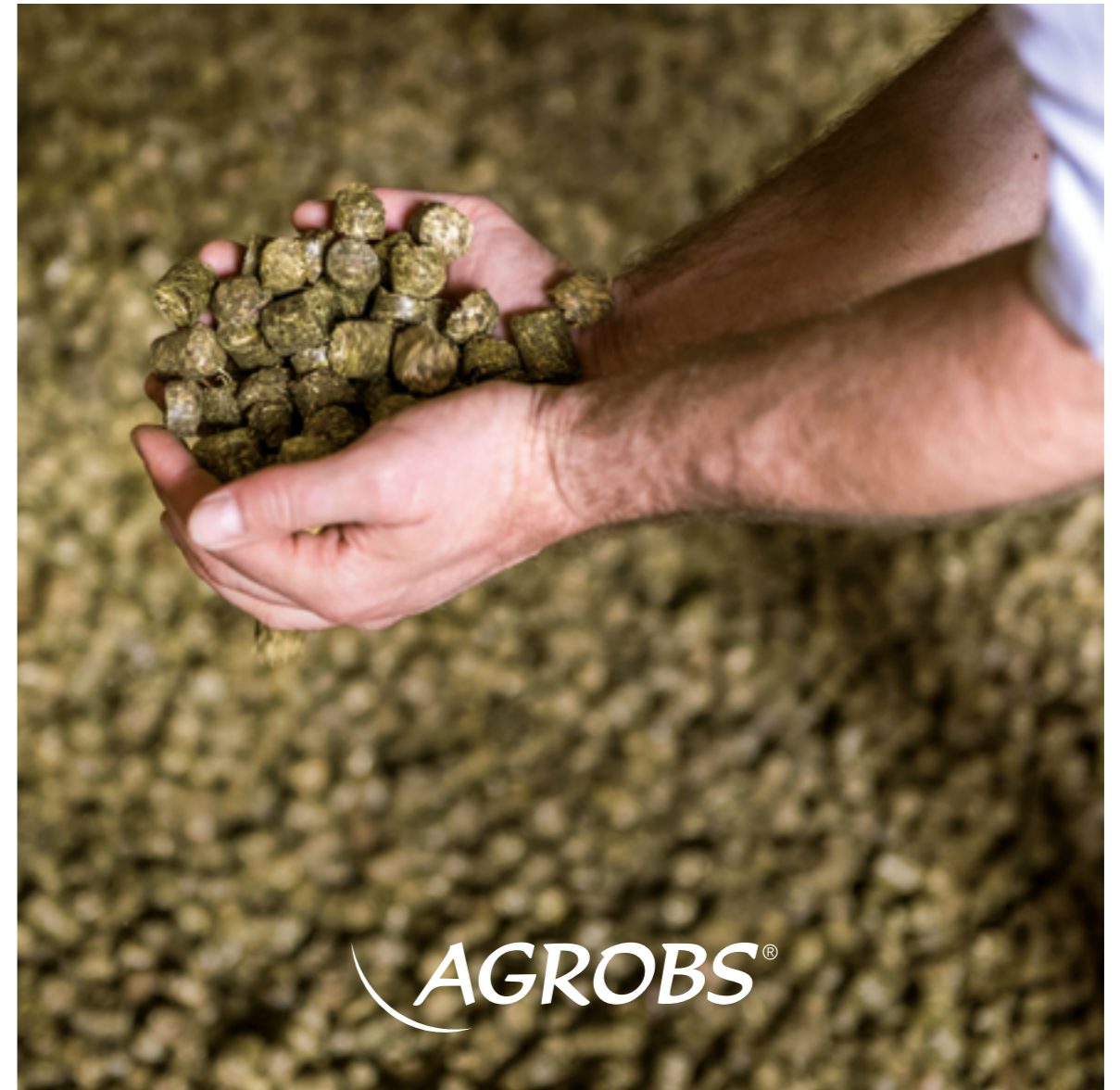
Von der Aussaat bis zum fertigen Produkt – alles in einer Hand